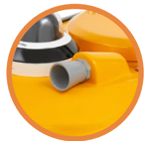
защита ОТ СТОЛКНОВЕНИЙ