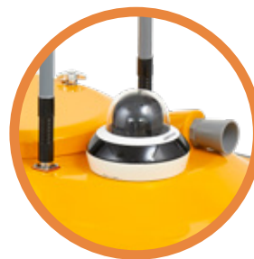
камера на 360°